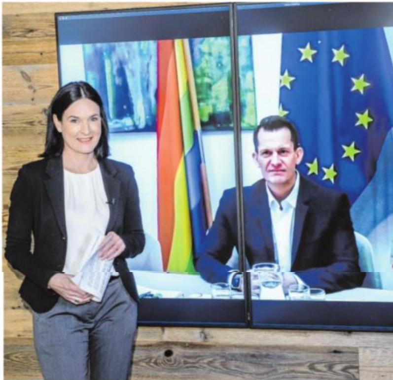
Gesundheitsminister Wolfgang Mückstein war via Zoom zu Gast in „Tirol Live“ bei Anita Heubacher.

stoff gekauft. Wie viele Dosen werden noch vor dem Sommer verfallen?